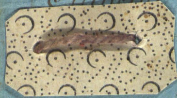
Tabella Użatku Wszelkiego Lboza w Polwarach Sorokaniach alias Czechowcach w Roku 1819 m Dnia 24. Julij Sporządzona