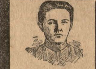
Išgydyta nuo: moteriškos ligos, kankynių ir akropilavimų, skaudėjimo sones, spūnarūse ir neuralgijos ligos. Jau pamatiskai sveika ir visai padėkavoja savo pavelską atlysdama.

Kad iš to žydniočio sodno daugiausia apdovanoja sergančius sveikata, tai aiškiai matyt iš daugybės padėkavonių, kurios ateina kasidiena, paduodame čion kelias.