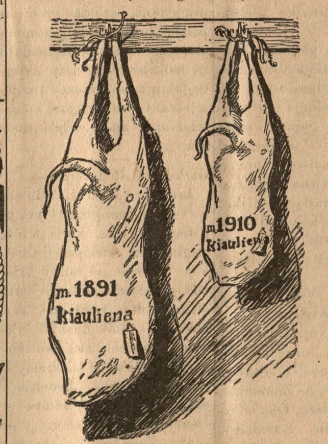
Paveikslėlis parodo, kaip 1891 metuose už tuos pačius pinigus galėjai nupirkti 104-ris syk didesnį gabalą kiaulienos, negu šiomet!

1891 met. krautuvėse jautienai (porter-house steak) mokėdavom 18 centų už svarą. Jeigu prileisime jos pabrangimą ant 12%, tai dabar reiktų mokėti už tokį pat šmotą jautienos 20 c. Bet dabar mokame 30 centų už svarą—reiškia kaina pakilo iki 66 2—3% Jautiena „sirloin steak“ buvo 10 c. svaras. Dabartinė kaina turėtų buti 11 c. Tuomtarpu mėš mokime 24 c., pabrango ant 140%. Jautiena „round steak“ buvo 11 c. svaras, dabar turėtų buti 12c o mokame 10 c., pabrango ant 63%!