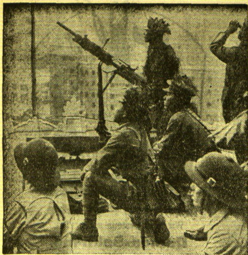
Luftschützmandöver auf den Dächern von Tokio

Mit die größten Luftschützmandöver, die bisher veranstaltet wurden, fanden dieser Tage in Tokio statt.