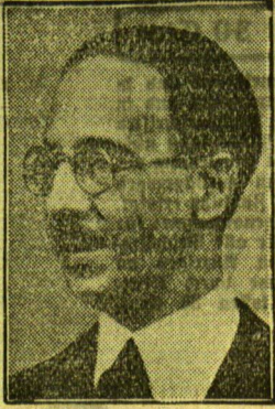
Der italienische Unterstaatssekretär Cuvich kommt nach Berlin