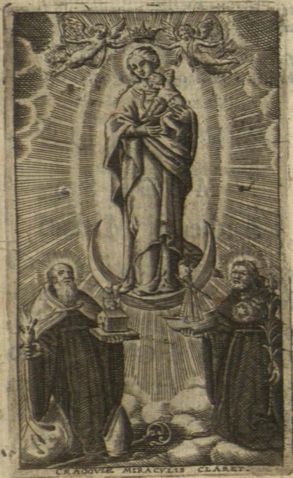
CRACOVIAE MIRACVLIS CLAREP.