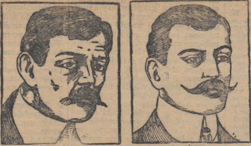
PRZED UŻYCIEM. PO UŻYCIU.

Ze względu na wielką doniosłość dzieła tego, a także, że dzieła podobne rzadko się pojawiają ze względu na znaczny koszt przy jego wydaniu, Zasady i Całość Wiary Katolickiej powinny znajdować się w każdej bibliotece zarówno osób duchownych, jak i świeckich. Zasady i Całość Wiary Katolickiej zamykają się w 8 tomach, każdy tom objętości 350-400 stron.