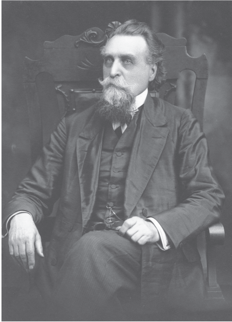
Jonas Basanavičius, 1913.