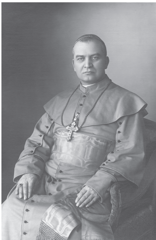
Vilniaus vyskupas Jurgis Matulaitis, 1922.