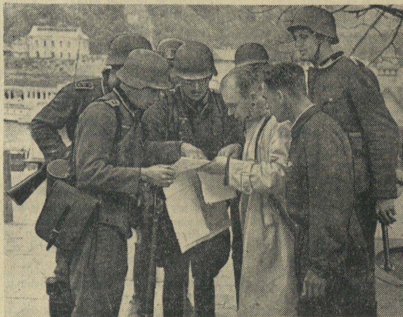
Aktyvistai aiškina vokiečių kariams Kauno miesto planą

Pakely konstatavome, kad daug kur veikė partizanai. Tačiau daug jų ir nukentėjo. Rusai žūdė ir visai nekaltus žmones. Zarasuose mums pasakojo, kad buvo rasta nužudytųjų su išbadytomis akimis, su išpiaustytais liežuviais.