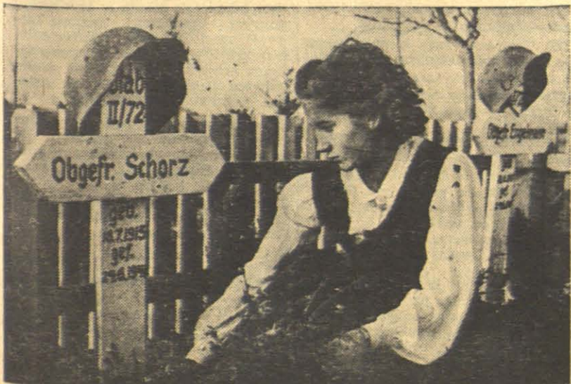
Puošiamas vokiečių kario kapas.

maite, Papilyje — Daukantas, Ka- majuose — Strazdelis, Naumiestyje — Kudirka, Sintautuose — Vaišaitis ir daug kitų. Drauge atsimena ir Vil- niaus Rasų kapai. Tai graži kalnuo- ta mirusiųjų pakalnė, gražiai stilin- gai išpuošta rudens pageltusių me- džių. Vilniuje, netoliese vartų, prie tako išsisi Dr. Jono Basanavičiaus kūnas, truputį į kairę, aukščiau į kalnelį, Čiurlionio kapas su tam tik- ru menų pobūdžio paminklu. Ten pat, netoliese, Povilo Višinskio ka- pas, su Lietuvišku mediniu kryžiumi. Ten pat Landsbergio-Zemkalnio ka- pas. Vilniaus Rasų kapuose, vienur ir kitur, tiesiog po visus kapus, už- tinkami ir lietuvių kareivių kapai. Jie buvo papuošti lietuvių karių ce- mentiniais kryžiais. Tikimės, kad vi- si, brangūs Lietuvos žmonių kapai, buvo ir kitur papuošti.