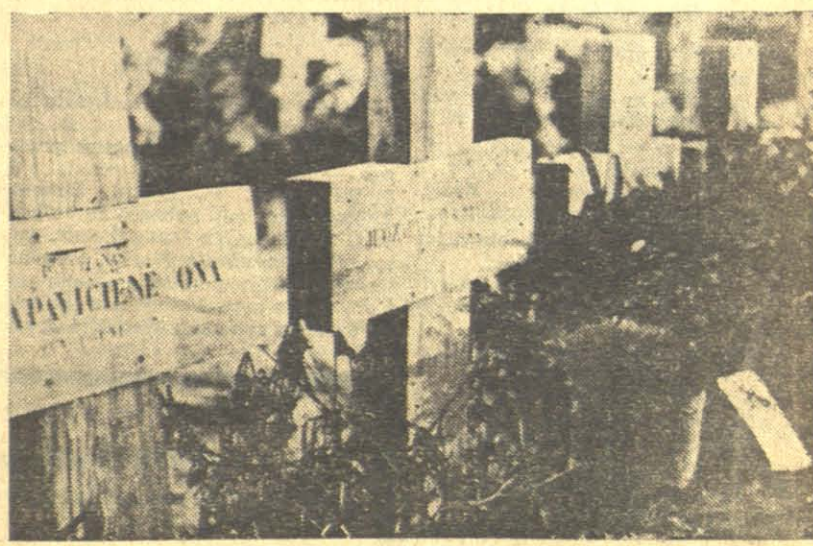
Žuvusiųjų partizanų kapų dalis.