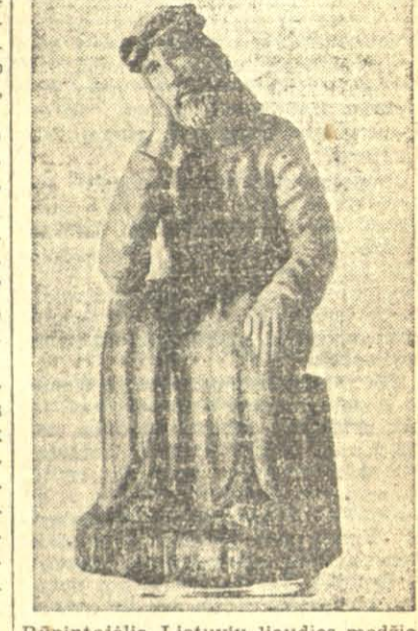
Rūpintojėlis. Lietuvių liaudies medžio skulptūra.