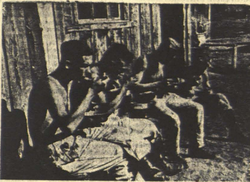
Po darbo valgis dar skanesnis, ypač darbo tarnybos vyrams Rytuose.

Literatūrinės, skaitymo knygos, chrestomatijos suvaidina tam tikrą vaidmenį literatūros gyvenime.