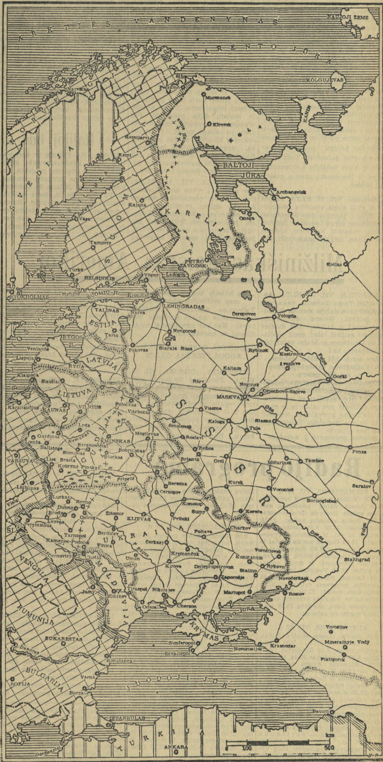
Skaitytėjai, nori nuolat turėti didžiųjų kovų valzdą, prašomi žemėlapiu nenumesti