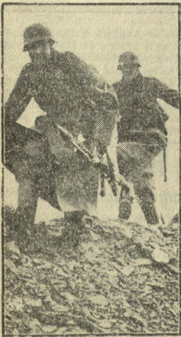
KAUTYNIŲ ĮKARSTY. Vokiečių pestininkai puola sudaužytą prieš apkašą.

KROKVA, VI. 27. ELTA. Varšuvoje įsisteigė „Generalinės gubernijos draudimo kontrolės biuras“. Biuras bus generalinės gubernijos vyriausybės žinioje.