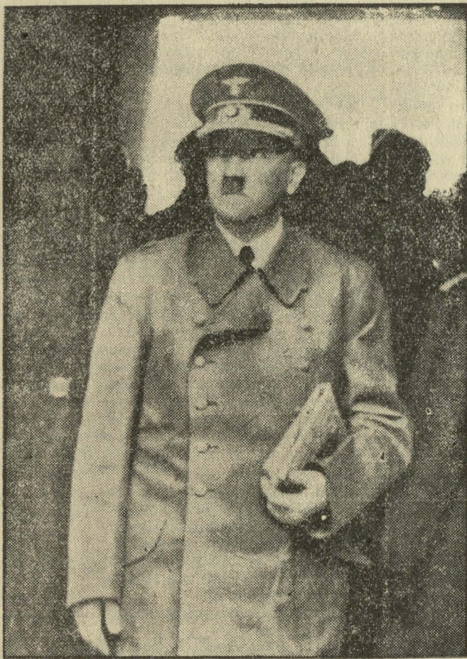
Adolfo Hitlerio mintys iš MEIN KAMPF

1. Kova prieš žydiškąją pasaulio bolševizaciją reikalauja aiškiai nusistatyti Sovietų Sąjungos atžvilgiu. Negalima velnią Belzabubu išvaryti (752).