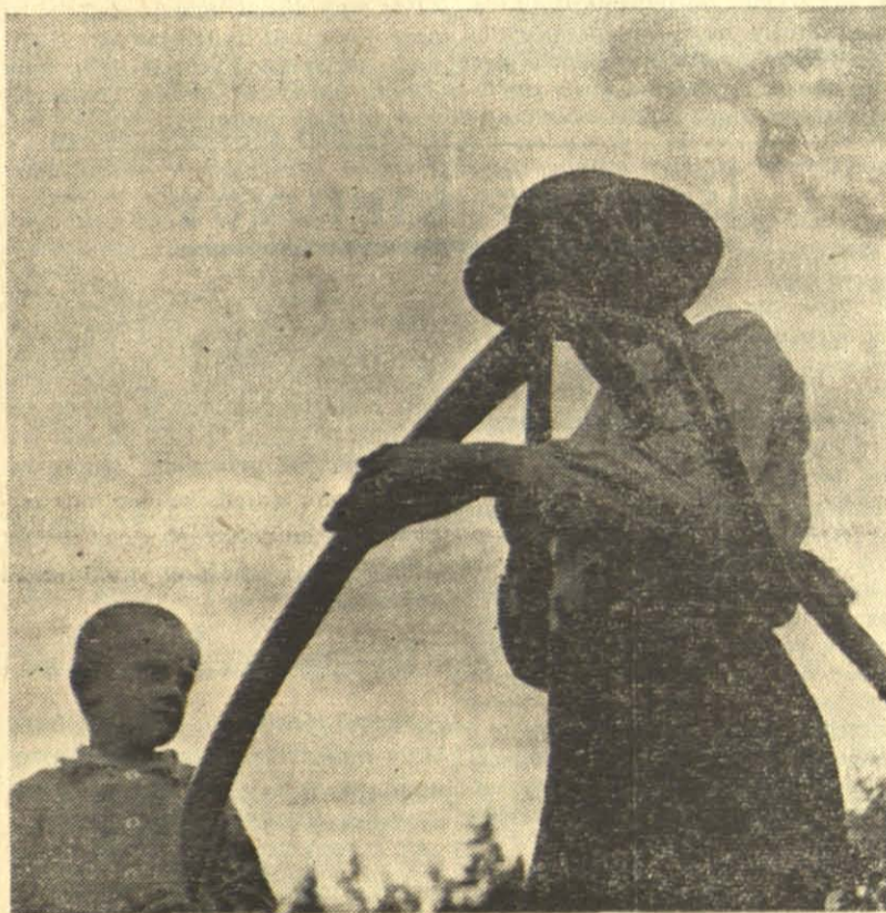
Vasarąjaus lauke

Darbo prievolė turi savyje tiek teigiamų savybių, kad jau prieš karą visa eilė valstybių, sekdamas Vokietijos pavyzdžiu, buvo ją pas save įsivedusi. Karo metu darbo prievolė buvo įvesta visoje eilėje naujųjų valstybių.