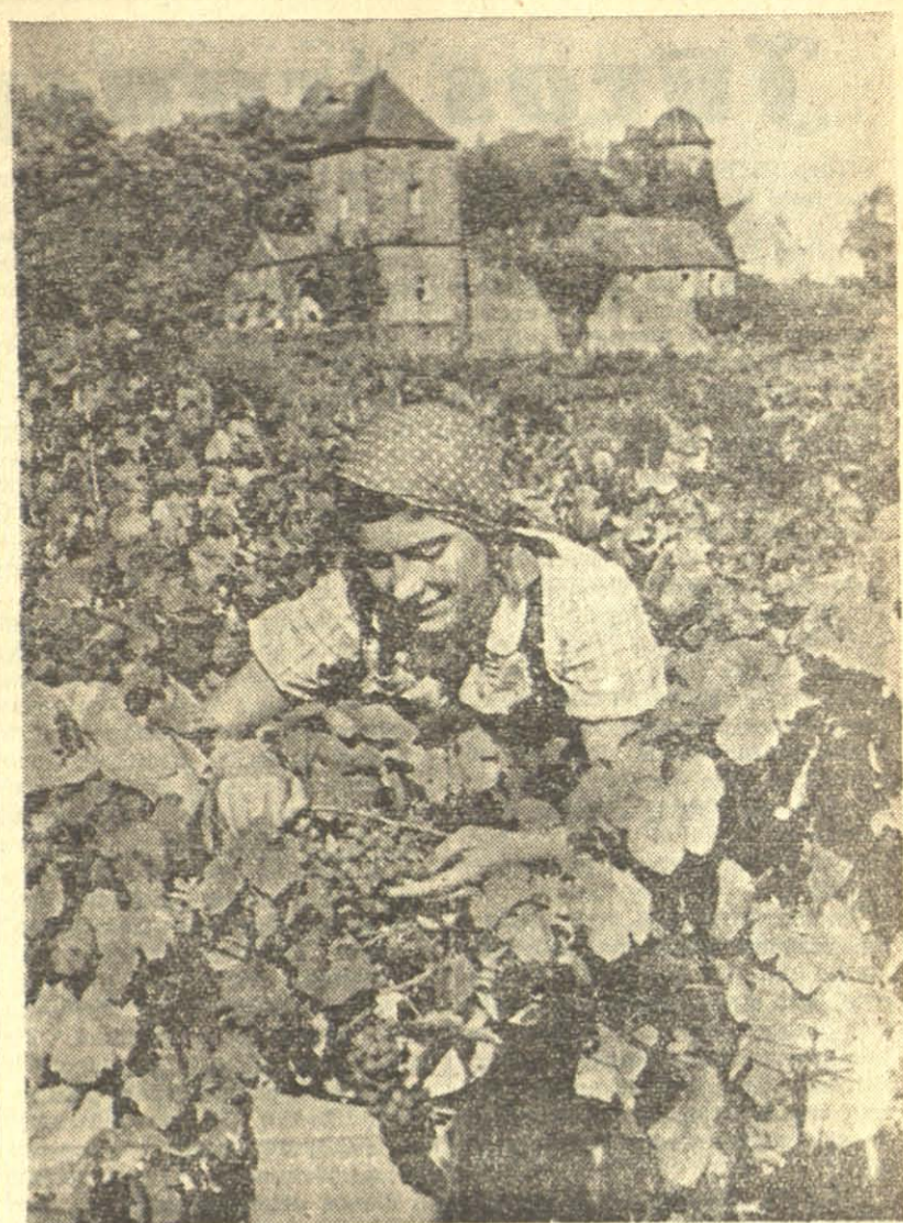
Pietinėj Vokietijoje jau prinoko vynuogės