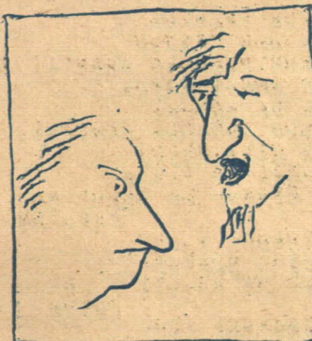
...Каб ты аханіўся...