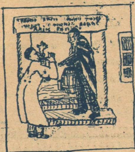
-Каб на цябя ірною падаткі...