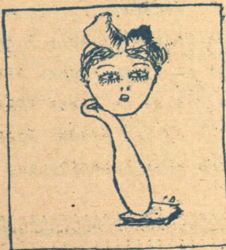
КАБ на вас...