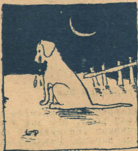
Барбос-Луци, якая яго укусіла?