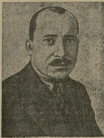
Старшыня саўнаркому Савецкае Беларусі.