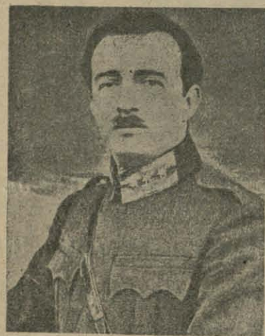
Падтрымліваны Італіяй прэзыдэнт Албаніі Ахмэт Бей Зогу.

дарог, каналаў. Атрымалі канцэсіі на нафту, вугаль і медзь. І нарэшце, каля 2-х месяцаў таму назад, у Ціране быў падпісаны Італьянска-албанскі гарантыйны дагавор, які поўнасьцю перадае Албанію пад уплыў Італіі. Албанскі прэзыдэнт Ахмэт Зогу Бей зьяўляецца поўным васадам Італіі, якім быў прызначаны Від у адносінах даваеннай Нямецчыны.