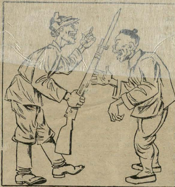
Бальшавік: Маім табе стрэльбу, цяпер бій англіяца.