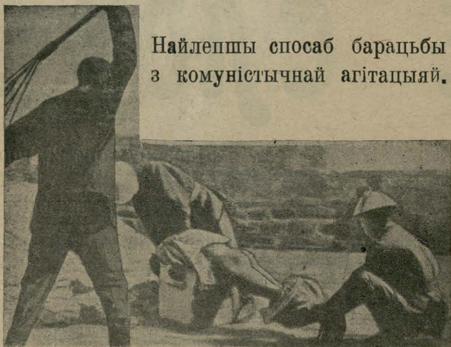
Найлепшы спосаб барацьбы з камуністычнай агітацыяй.