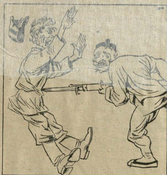
Кітаец: Добра, братка, але спрабую яе на табе. „Mucha“