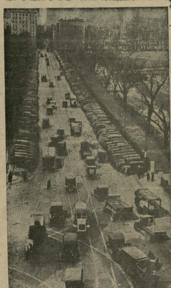
Станцыя самаходаў у Бастоне (Амэрыка) раніцою.

іхнія блізка прыяцелі з в. Юхавічы, раней шчырыя грамадзін, а цяпер, дзеля выкарыстання легальнай партыі Ярэміча для падпольнай „працы“ ў камуністычным напрамку—прыяцелі і „сымпатыкі“ Сельсаюза.