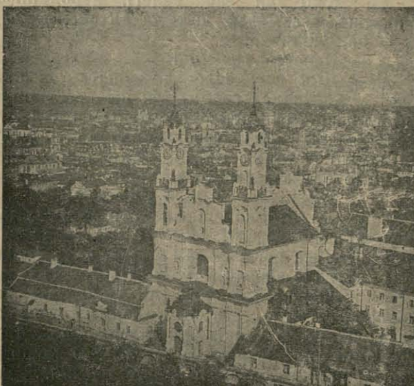
Від на Вільню. На першым пляне Місянарскі касцёл.