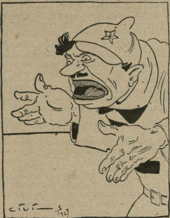
— Хаця зубоў ня маю, але ў мяне доўгі язык... (Сегодня).

У апошнія дні бальшавіцкія правадьры шмат крычаць аб ваеннай небясьпецы і пераможнасьці С. С. Р. Р.