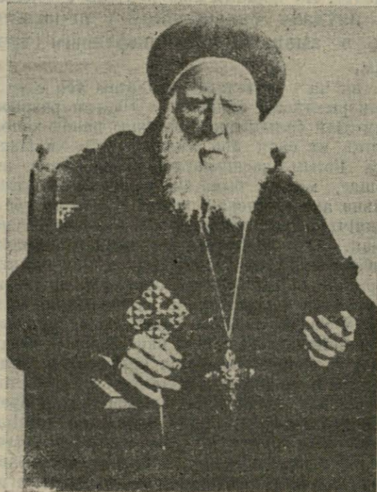
Амаль найстарэйшым духоўным на сьвеце быў памёршы царь ў Эгіпце кэптыўскі патрыярх Эгіпту, Судана і Абісыніі Кірыла V, які пражыў 100 гадоў, з якіх 53 быў патрыярхам.