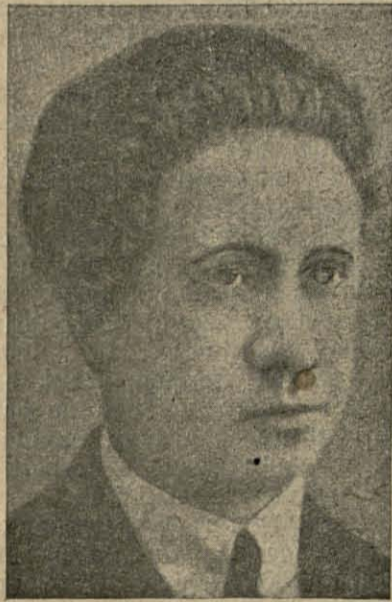
Фатаграфія прывадьра Незалежнай Партыі Хлопскай, савозьніка Грамады — Ваводзкага—аб'явавакатарскай дзейнасьці якога падаем ніжэй.