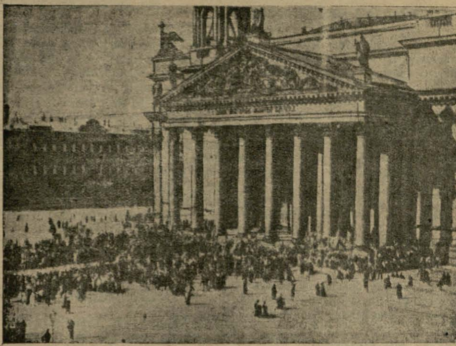
Ня гледзячы на ўсе пераследаванні хрысьціянскай веры більшавікамі, рэлігійнасць у Савецкай Гасейі ня толькі ня упала, а выршла і ўкаранілася. Аб гэтым яскрава сьведчыць вышэй падавая фатаграфія. Гэта відомы Іскіеўскі Сабор у Петраградзе, з якога выходзіць пасля службы таўпа народу.