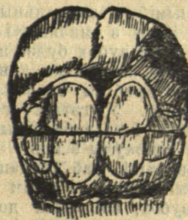
Рис. 2. Пярэднія зубы ў каня ў 3 гады.

Далей, праз кожны год, конь скідаець па дзьве пары (па 4 пары ўверх і ўнізе) малочнікаў, на месца каторых зьяўляюцца сталыя зубы, якія праз паўгода раўняюцца з першымі. Так што ў 3½ гады ў каня прарэзваюцца сераднякі, якія да 4 гадоў вырастаюць роўна з захватнікамі, а ў 4½ прарэзваюцца і сталыя крайнікі. У пяціхгадовага каня крайнікі выроўніваюцца з сярэднімі і прыблізна каля гэтага часу ў жарабцоў вырастаюць клькі (клы). Значыць, пяціхгадовы конь маець усе сталыя зубы і клькі.