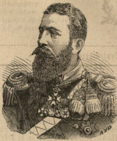
Aleksandras I., Bulgarijōs Kunigaikštis.

Frankfurte pr. M., 2. Sept. Kara- liuno Namikėi Rtyoj Wakare ant Žę. 10 czion pernakwos.