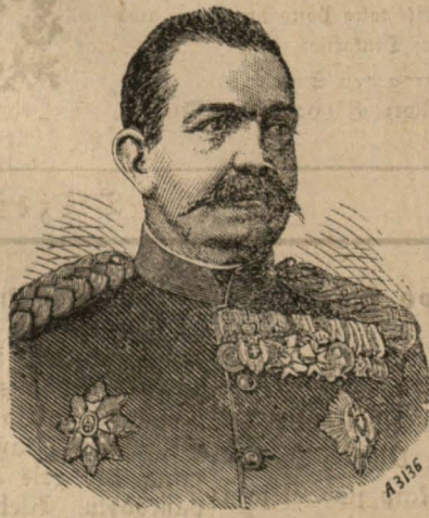
Milans I., Serbijōs Karalius.