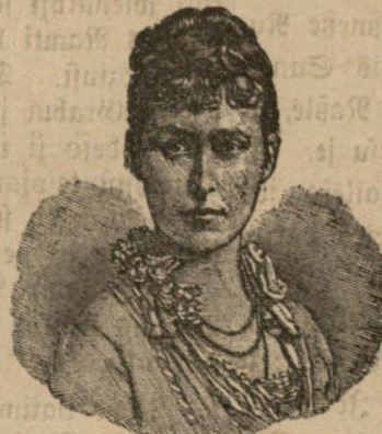
Princese Irene is Hessū.

— 18. Sept. Ciecorėne prastojo wakar Berlyne ir pasidawe su žiuponėmis ir Bo-nais, je palydenczis, nu Potsdamerit Gelsfeldwaro su ipatisku Trukiu ant kelitū Re-delitū Sweifatds Wandens Wartojimo i Ba-den-Baden. Apie Ciecoraus žskeliawimq i Baden-Baden dar bus weltaus padawadyta.