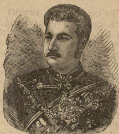
Princas Ferdinands iff Koburkio, naujēs šfirtasīs Bulgarū Kunigaitfētis.