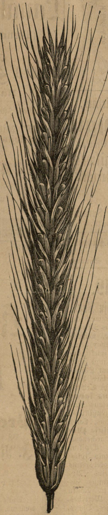
Bayriſkiejie Rugin Kamaros Rugin. Dibumas nenuatufiame Paſſilaityme.

Kadangi Gaspadoriei ne tikt per Seklos Sucziedyjimq, bet ir per twirtas bey didzias Dagas didi Nauda igabena.