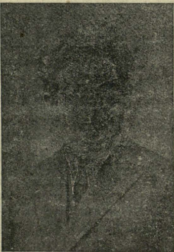
Максім Бурсэвіч, генэр. сакрэтэр Бел. Сял.-Работн. Грамады, засуджаны 22.V 1928 г. на 8 г. цяжкага вастр.

Высокі Суд! Канчаем тут вялікі, можа, навет, найвялікшы палітычны працэс, які перажыла Ненадлеглая Польшча. Усе мы выканалі каласальную працу і вось ужо зблі-