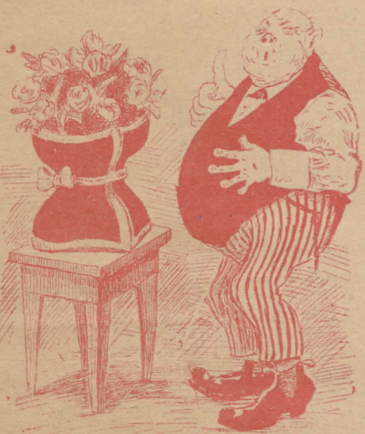
— Миленькій сюрпризъ для Амаля Кар- лефна...