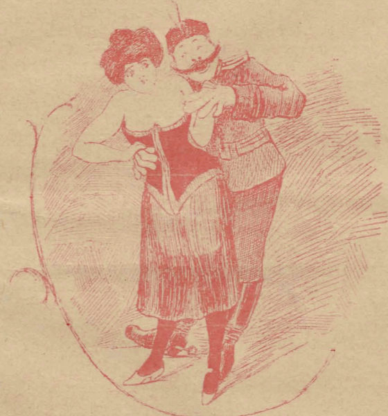
— Что вы дѣлаете, нахаль? — Маленькій обыскъ, по предписанію начальства.