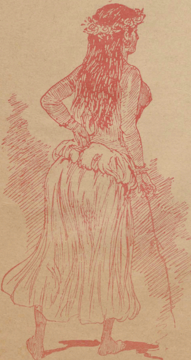
Костюмъ весьма недорогой, но для глазъ пріятный.