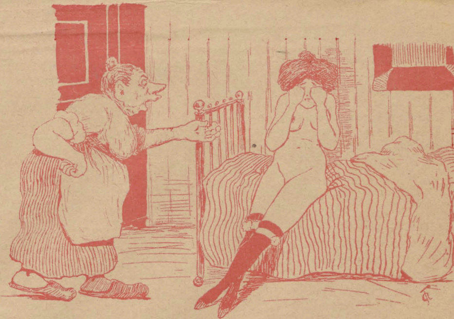
— Хорош! нечего сказать, безстыдница! Говорила тебѣ не связывайся съ околдочнымъ! Гдѣ же одежа-то вся? — Конфискована, маменька!