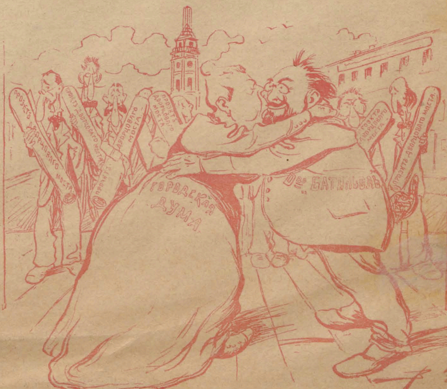
— Пускай толпа клеимитъ презрѣньемъ «Нашъ неразгаданный союзъ!»