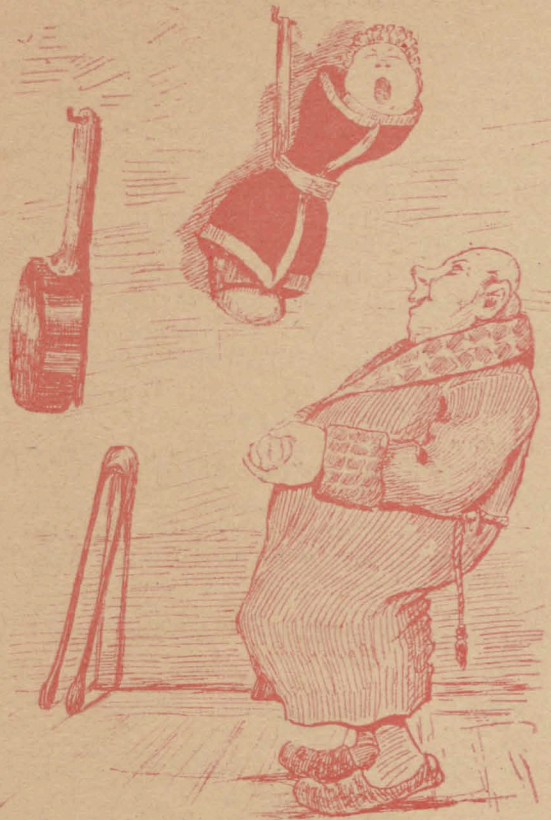
— Съ этихъ лѣтъ привычай къ корсету— благонамереннымъ гражданиномъ судешы!