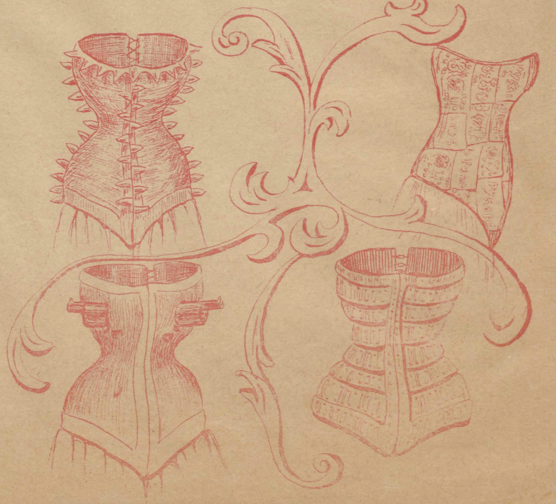
Корсетъ для самобаром.