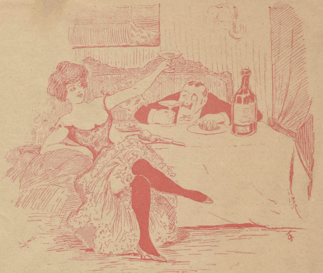
— Пью за «Новое Время». Благодаря помещенному тамъ объявленію мы познакомились съ тобой и теперь я скоро поправлю свои дѣлишки.