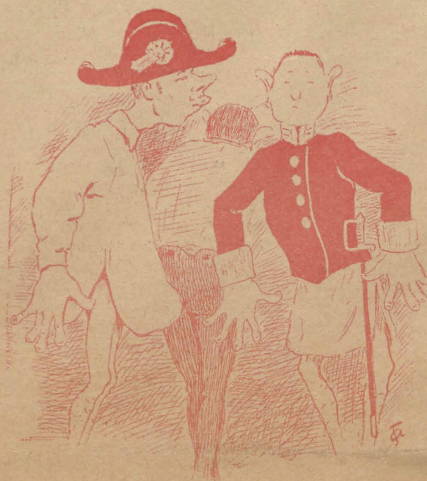
Разорившись во время аграрныхъ безпо- рядковъ папаша смогъ заказать только одну форму для трехъ сыновей-правовѣдовъ.