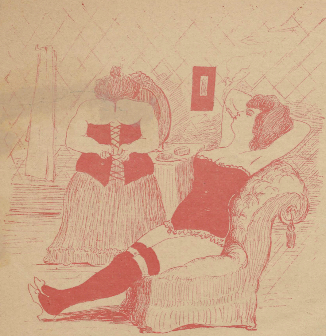
— Ну, как твой хулиганъ поживаетъ? — Пожалуйста не выражайся! Онъ теперь сотрудничаетъ въ «Русскомъ знамени».