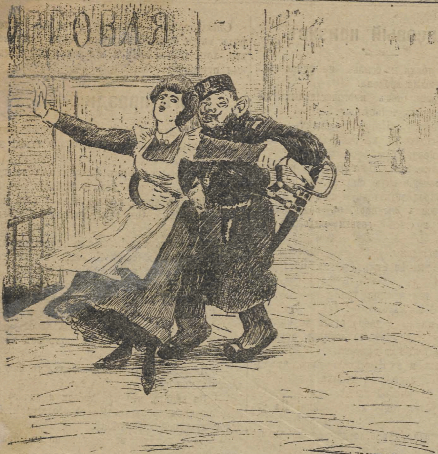
Вы милочка не манерничайте, ежели же вы отъ городского отъбиваетесь стало быть в-ась настоящая неблагонадежность сидить, а за это, с ми знаете не похв лять.