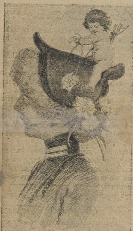
Модная весенняя шляпа къ сезону шалостей амура.