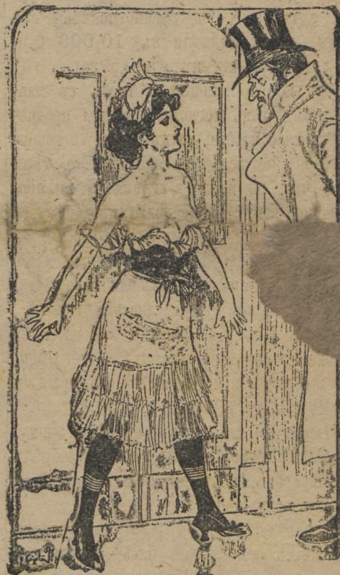
— Лидія Ивановна у себя?.. — У себя!.. только онъ сейчасъ не принимаютъ.. А вы къ ней христосоваться? Если желаете, я васъ приму... и могу похристосоваться... Вы не бойтесь: я имъ не скажу!