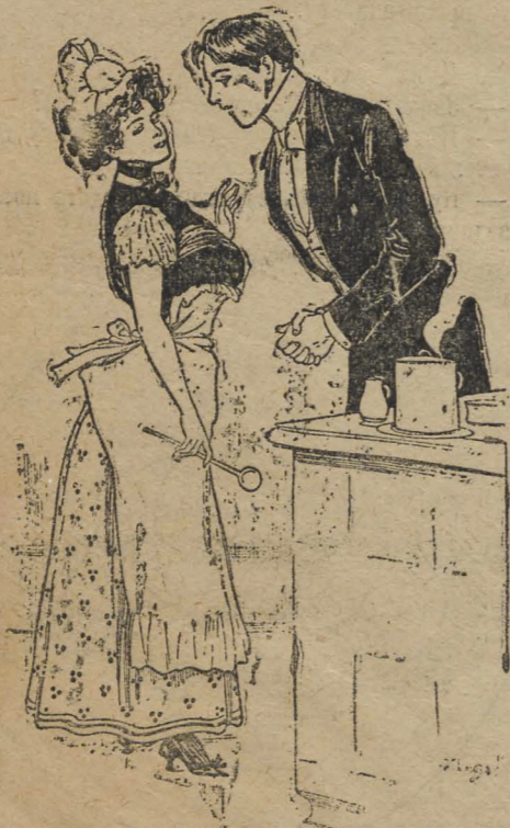
— Милочка, но почему же ты не хочешь со мной похристосоваться? — Не могу мнѣять своихъ убѣжденевъ! Вы вѣдь въ П.-П.-П. записались, а я— конституционалистка демократка.