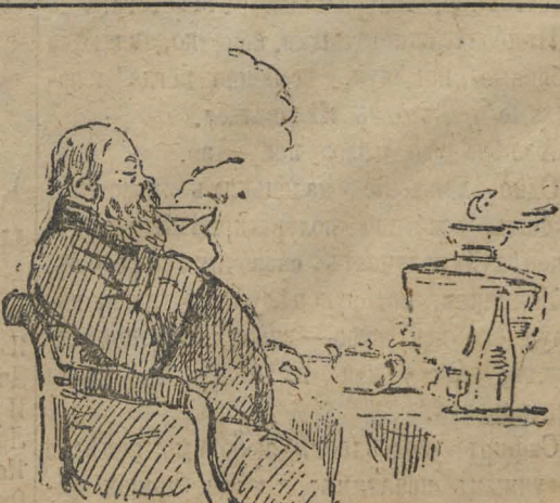
— Я ужъ на свой вѣкъ нахристосовался, пушай теперь другіе нос-т-ся, а мы чайкомъ побалуемся, куда спокойнѣе.