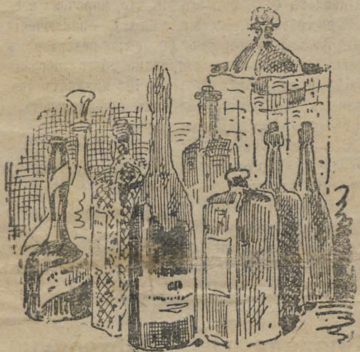
И мѣ намъ тоже будутъ прикладываться, только не троекратно, а охъ-какъ многократно.