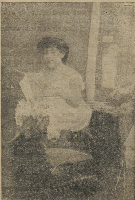
Лучше совсѣмъ не одѣваться. Сегодня всѣ мои друзья придуть съ поздравленіями.