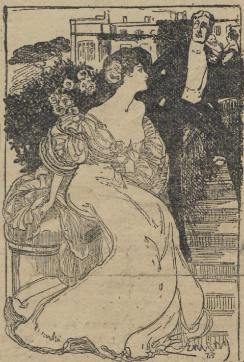
— Терпѣть не могу ученыхъ женщинъ, и если женюсь, то непременно, чтобы моя жена была глупѣе меня! — Да, но найдете ли вы такую?