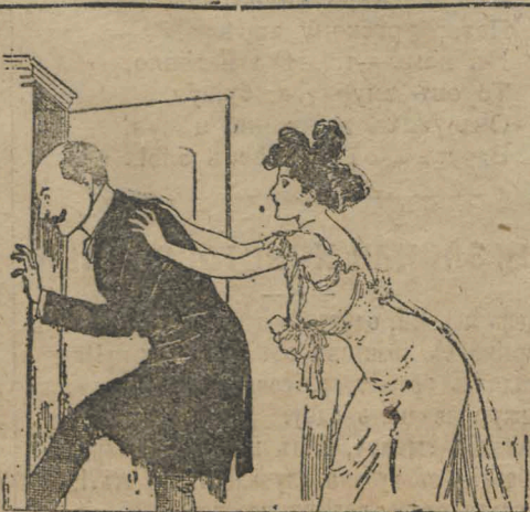
— Вы слишкомъ рано пришли христосоваться. Мой мужъ еще не ухажалъ съ визитами. Посидите пока здѣсь.