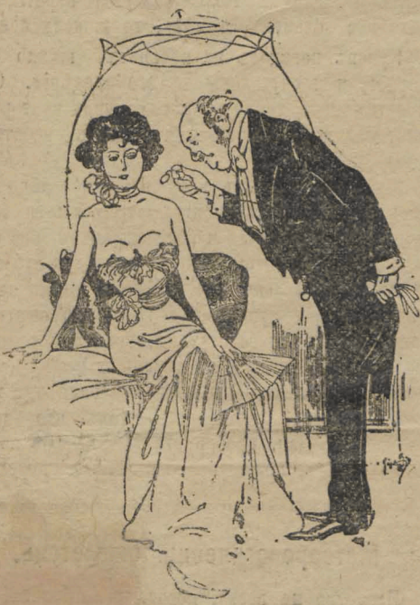
— Нѣтъ, нѣтъ, я съ мужчинами не христосуюсь... — Но, вѣдь, я тоже не христосуюсь съ мужчинами, а только съ дамами.