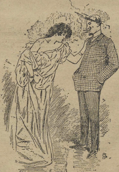
— Ахъ, Штя, какой я видѣла сегодня чудный сонъ. Будто ты купилъ мнѣ на Пасху бархатное пальто... — Ну, подождемъ до завтра. Можетъ быть, ты увидишь во снѣ, гдѣ я взялъ денегъ на это пальто.