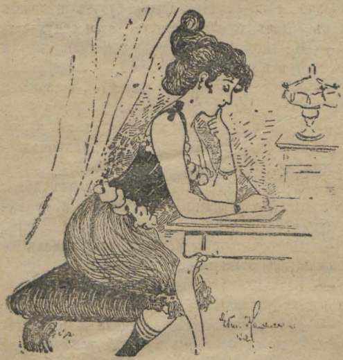
— Гдѣ бы назначить ему свиданье? Около Государственной Думы? Опасно—тамъ много гороховыхъ пальто. Могутъ за «эссеровку» принять... Ва, около Поцѣлуева моста!