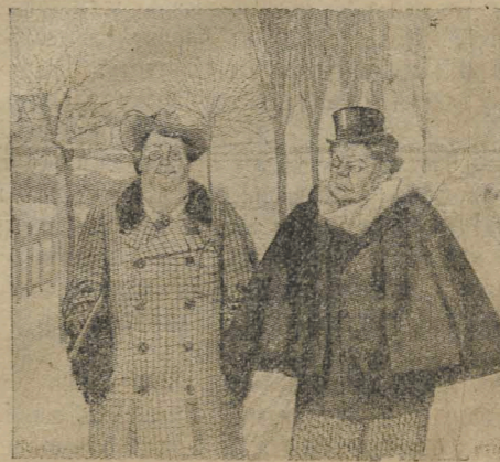
— Несчастье имѣть деликатную жену! Не могу, говоритъ, при тебѣ христосоваться, смущаюсь. Вотъ я цѣлый день по улицамъ и гуляю.