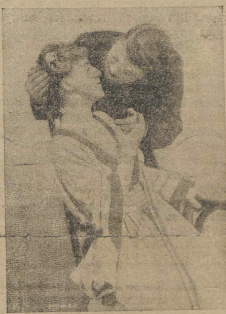
— Почему дашь за поцѣлуй? — Гм... Я думалъ для тебя цѣловаться ни почему!