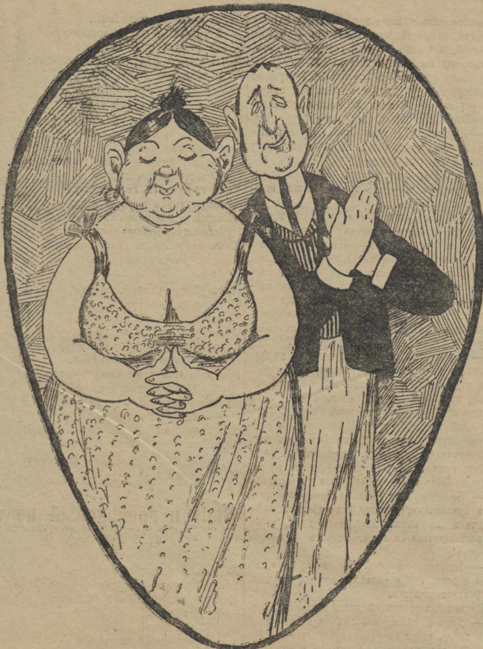
«Пощлемуъ дай забвеніе, «Муки сердца исцѣли»

Визитеръ. Я тебѣ даю рубль за два маленькихъ курса, а ты, братецъ, еще недоволенъ! Извозчикъ. Эхъ баринъ! Да мѣдь по нѣшнему курсу—это все равно што платинникъ!