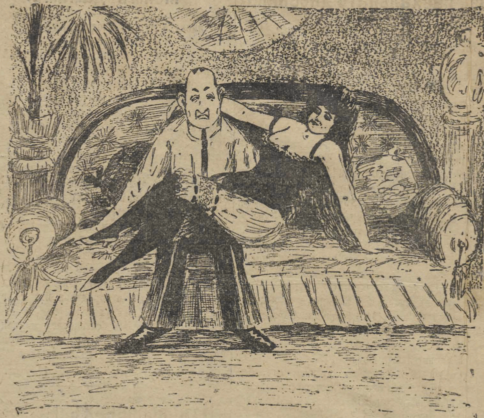
Бюрократъ на отдыхѣ.