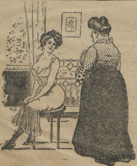
— Какъ тебѣ не стыдно было вчера такъ цѣловаться съ кузеномъ... — Да я, маменька, для сегодняшняго дня дѣлала, чтобы передъ визитерами не