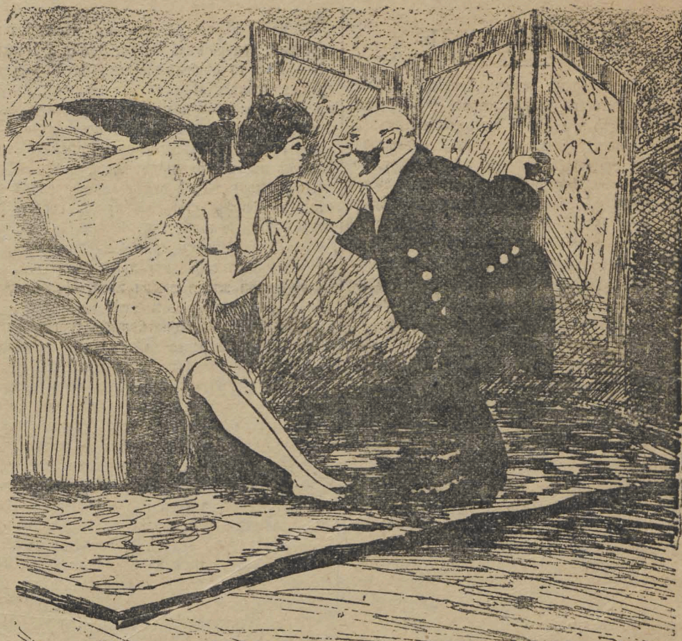
Дусенька, дай безеточку, да я тебѣ вмѣсто подарка принесу мою звѣзду; можешь ее сегодня поносить, куда хочешь нацѣпи, и мнѣ не убыточно, и тебѣ лестно.