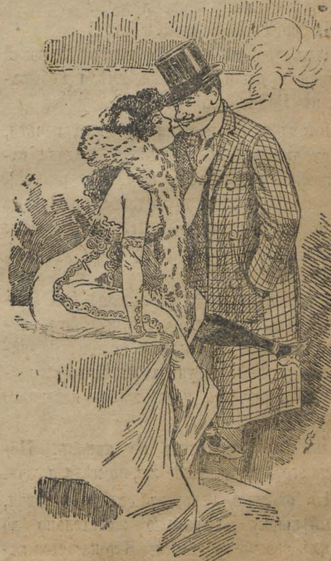
— Можно васъ поцѣловать? — Угостите сначала ужиномъ, а то я чувствую упадокъ силъ. Вы уже сегодня сто первый. Такой боевой день выпалъ!