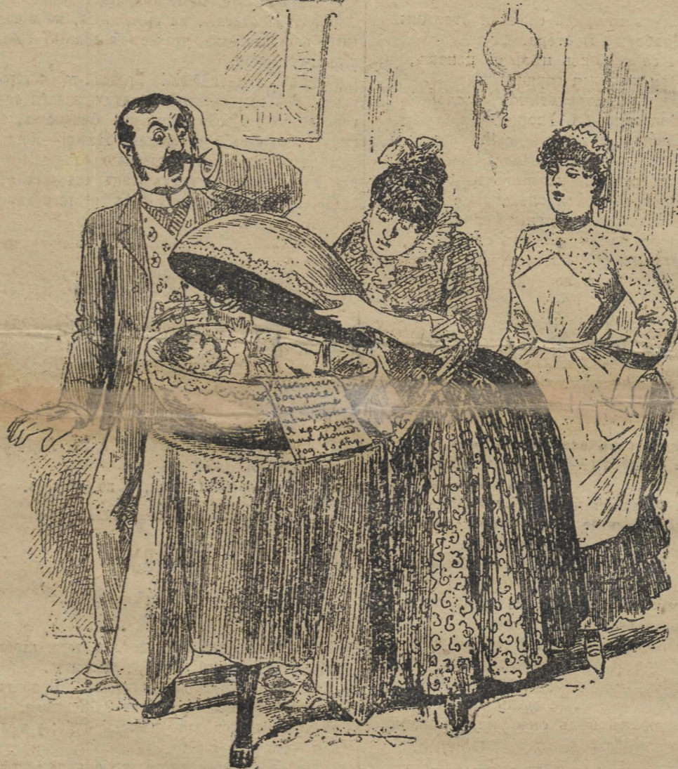
Горичная.—Барышня какая-то сейчасъ это яйцо принесла. Передайте, говоритъ, барину вашему отъ меня подарокъ.