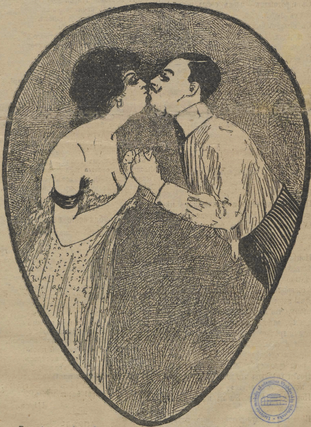
— Ты мнѣ не измѣнишь? — О, будь спокоенъ, милочка, я буду тебѣ вѣрна до послѣдней копейки!