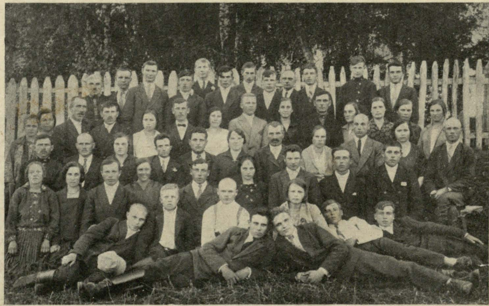
Ельцаўскі гурток Т. Б. Ш. Ваўкавыскага павету (гл. справ. ст. 8)