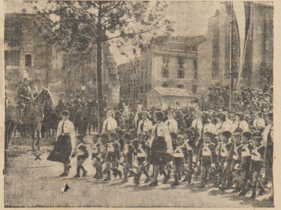
W dniu 10-ej rekrutacji faszystowskiej, który w roku bieżącym był zarazem rocznicą przystąpienia Włoch do wojny światowej, przemaszzerowały przed Mussolinim najmłodsze oddziały organizacji młodzieży „ballilla”, zwane „Synami Wilczy”. W dniu 10-ej rekrutacji faszystowskiej, który w roku bieżącym był zarazem rocznicą przystąpienia Włoch do wojny światowej, przemaszzerowały przed Mussolinim najmłodsze oddziały organizacji młodzieży „ballilla”, zwane „Synami Wilczy”.