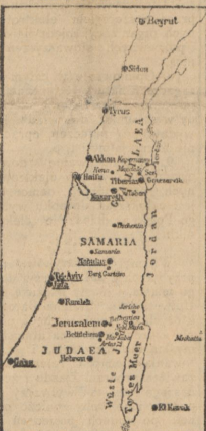
Miejscowości podkreślone były ostatnio terenem zajęć antyżydowskich i anty-angielskich.