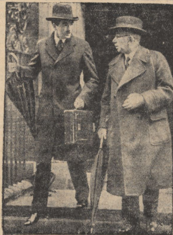
Min. Eden w towarzystwie min. J.H. Thomasa, opuszczają gmach Rady Ministrów, po naradzie nad wypowiedzią Hitlera.

Firma J. KŁODECKIEGO pamięta: ZAMKOWA 17, co chce wszystko tam kupi i spędzi wesoło, radośnie święta.