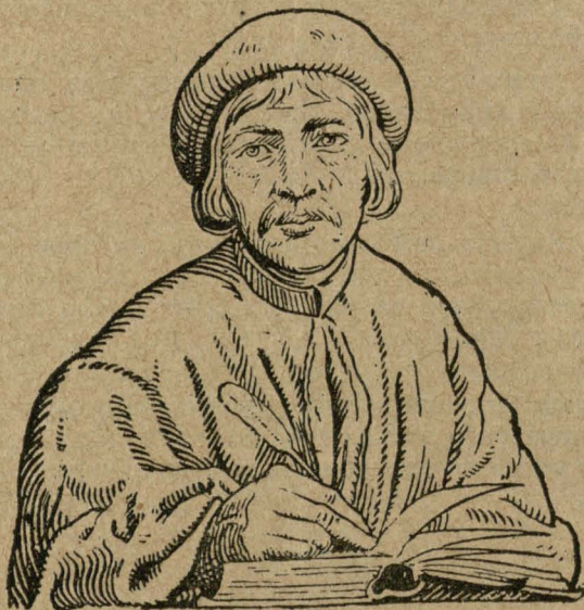
Др. Францішак Скарына.

Але праца ў Празе Скарыну нездаволіла: ён забраў-