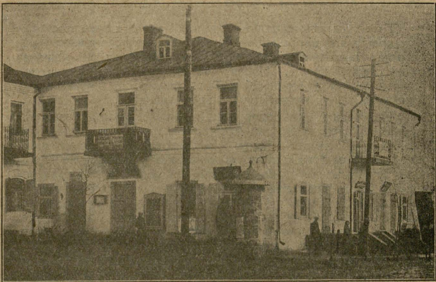
Будынак у каторым месьціца Наваградская Беларуская Гімназія.

Польскія-ж школы дзеля гэтых самых прычын для беларускіх дзяцей зусім не падходзяць, там вучаць у чужой