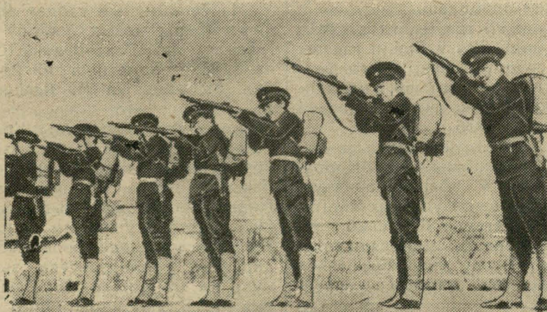
Kitajskija studentki z Univerzitetu ŭ Sanhaju, prachodzjać vajs-kovyja čvičeñni i vučacca stralać, kab mahčy ŭsiebakova baranić svaju bačkaŭščynu ad varožaha čužynca.

Na Dalokim Ŭschodzie, zusim mahčyma, što vajna patryvaje doŭha. Japonii buduć pamahać Niemcy, Italija, a Kitaju kamunisty. Tam moža być štoś padobna ha jak u Hišpanii, tolki z toj różnicaj, što kali ŭ Hišpanii majuć bolš šansaŭ na pieramohu pačynalniki čatniaj vajny — paŭstancy, to na Dalokim Ŭschodzie — Kitajcy, ŭ na