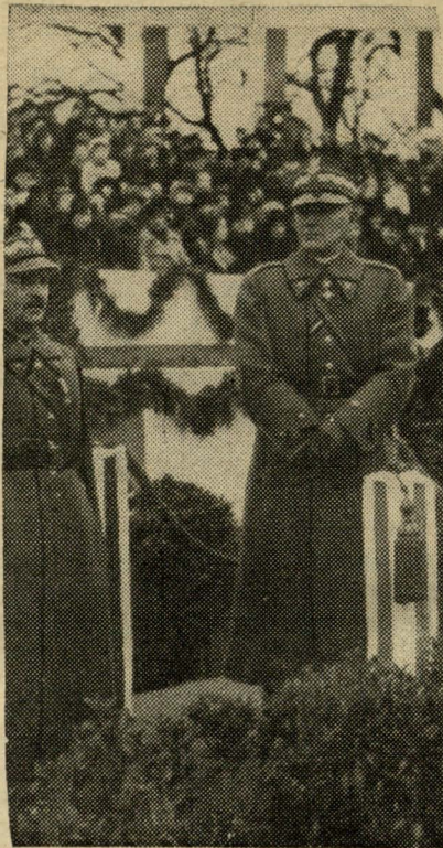
Hałoŭny kamandzir polskaje armii Maršałak E. Rydz-Smiłty, u časie pryjmañnia defilady 11.XI.1938.