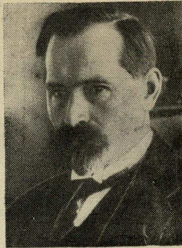
Prezydent A. Smetona.

Revizii, aryšty, ssylki nia strym-livali i nia žbivali jaho z vybrana-ha šlachu. Urešcie A. Smetona 16.II.1918 h. pieražyŭ vialikuju hi-staryčnuju chvilinu, budučy star-šynioj kanferencyi 264 litoŭcaŭ,