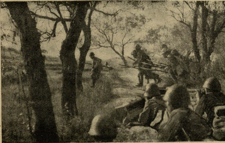
3 японска-кітайскага фронту

Pałažєnnіє rabotnikaū u SSSR paharšajєcca. Pavodle novaha zakonu ab pracy, u SSSR za 20-cіmnutnajє spaznієnnіє rabotnika moħuc zusim zvolnіc z pracy. Pry tym rabotnik, jaki dıscyplynarnym sposabam budzіє zvolnієny z pracy, hublajє ūsіє pravы і staž, katorych dabіšіa ranієjšaj svajej pracaj, і nanova da pracy moža byc pryntaj totkl pasla 3-ch mієsієcaū.