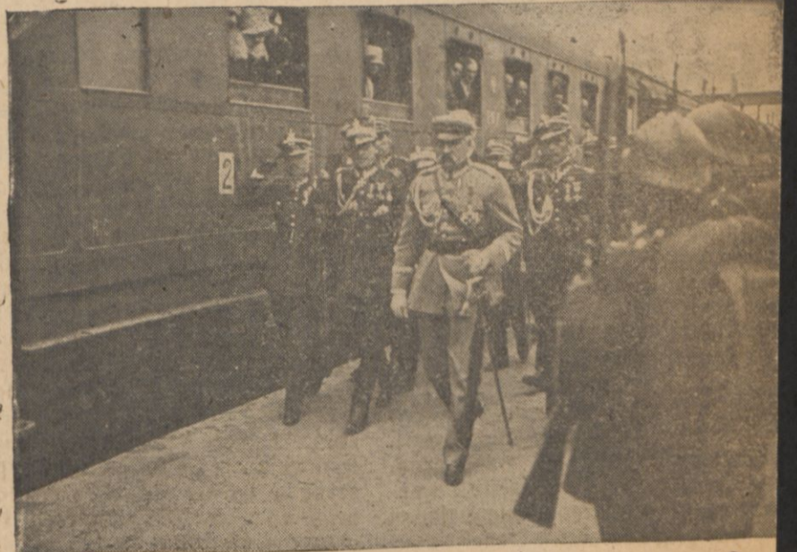
Marszałek Piłsudski przed frontem kompanii honorowej w chwili po przybyciu do Wilna.