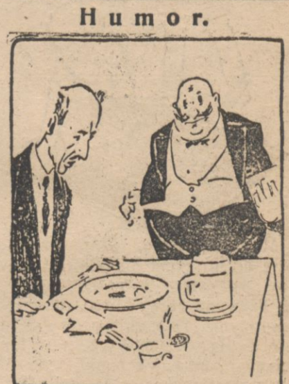
Humor. — A co to jest wściekiwie? Rzeszki po kimś, czy też befsztyk, który zamówiłem?

MEBLE Łóżka angielskie fabryki „Konrad Januszkiewicz i S-ka” Tow. Akc. w Warszawie. Meble gładkie, fabr. „Thoneta”, otomany, materace, kredensy, stoły, krzesła, szafy, garnitury salonowe, meble biurowe i t. p. POLECA D. H. F. MIESZKOWSKI, Wilno, ul. Ad. Mickiewicza 23. Tel. 2-99. Na prowincję wysyłamy towary za zaliczeniem. 5695 a-2