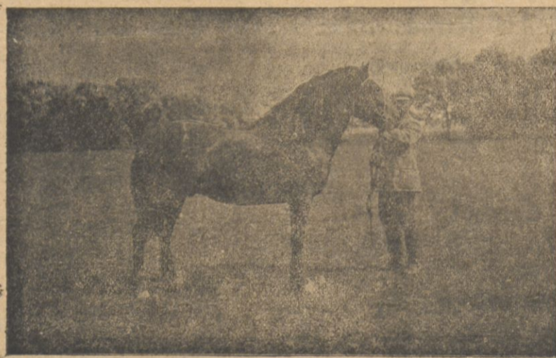
Piękny okaz reproductora na pokazie w Szarkowszczyźnie (r. 1926).

Kursy rolnicze: Zorganizowano na terenie Kółek Rolniczych we wszystkich powiatach krótkoterminowe kursy rolnicze w 32 miejscowościach.