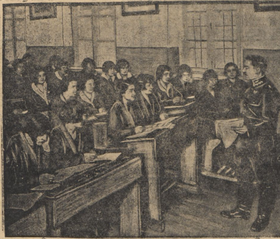
Wykład o wychowaniu fizycznym kobiet.