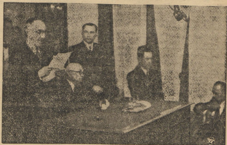
Zdjęcie przedstawia moment z przemówienia premiera albańskiego Shkata Verlazzi, w którym prosi króla Wiktora Emanuela o przyjęcie korony albańskiej.

W odpowiedzi Wiktor Emanuel III podziękował za ofiarowaną mu koronę i oświadczył, iż przyjmuje koronę, z którą związane jest sławne imię bohaterów albańskich Skanderberga. Król dodał następnie, iż przyjmuje przysięgę narodu albańskiego na wierność oraz zapewnił, że rząd jego zobowiązał się zagwarantować Albanii porządek, poszanowanie swobód religijnych, postęp cywilizacyjny, sprawiedliwość społeczną, a wraz z obroną wspólnych granic również pokój.