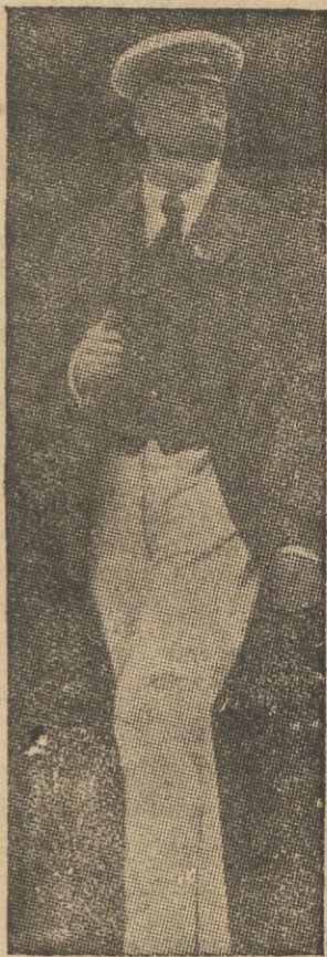
który ukończył 67 lat. Dzień urodzin Króla był niezwykle uroczysto obchodzony w całej Anglii.