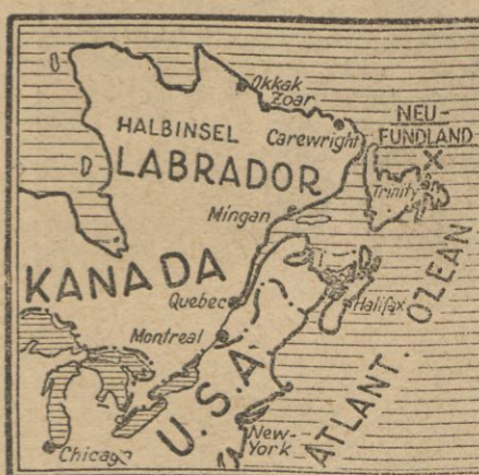
× tam, gdzie poraz ostatni widziano aparat.

WIDZIANO W NOWEJ SZKOCJI LONDYN (PAT). — Według ostatnich wiadomości, dziś o godz. 8,44 według cza-