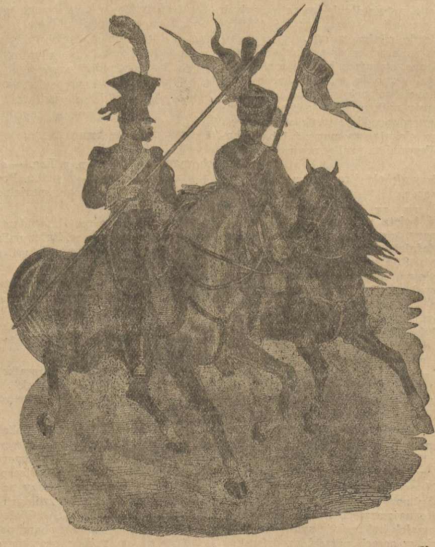
(w-g ryc. w dziele Emiele Margo de Saint - Hilair)

Tatarzy, odznaczający się zamiłowaniem do rzmiosła rycerskiego i święcie dotrzymujący przysięgi, byli doskonałym materialem żołnierskim; to też oddziały tatarskie w szeregach wojsk litewsko-polskich widzimy podczas wszystkich wojen, nie wyłączając walk z Tatarami i Turkami.