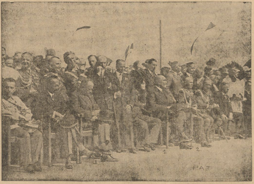
Tysiące legionistów zjechało się dnia 14 b. m. na dorocznego zjazdu Związku Legionistów, który odbył się w tym roku w Gdyni.