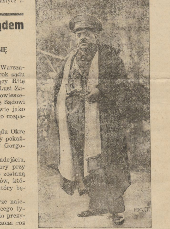
Na zdjęciu widzimy gen. San Jurjo, wodza powstania monarchistycznego w Hiszpanji, które wskutek braku organizacji zakończyło się niepowodzeniem. Gen. San Jurjo został ujęty i oddany pod sąd wojenny.

nąć na sposób japoński. Przewornym stróżem ładu i bezpieczeństwa, wyprawa wydała się bardzo podejrzana, gdyż był to czas krwawych walk na polach Mandżurji a imiona i ekipunek turystów, jeszcze bardziej podejrzania te wyolbrzymiały.