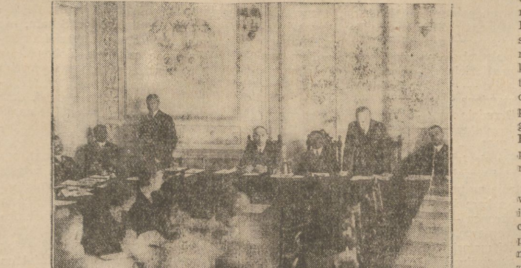
W gmachu Ministerstwa Rolnictwa i Reform Rolnych rozpoczęły się w środę obrady Stalego Komitetu Studjów Ekonomicznych państw Europy środkowej i wschodniej. Ze strony polskiej wzięli udział w zagaj-