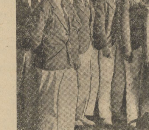
Przybycie olimpijczyków do Gdyni

W czwartek powróciła z Océanu polska drużyna olimpijska. Przedstawiciele władz sportowych oraz liczne tłumy publiczności powitały olimpijczyków przy przybyciu „Pulaskiego” do moła w porcie gdyni. Po mowach powitalnych olimpijczycy poprowadzeni orkiestrami udali się na dworzec kolejowy, gdzie podejmowani byli przez komitet przyjęcia śniadaniem.