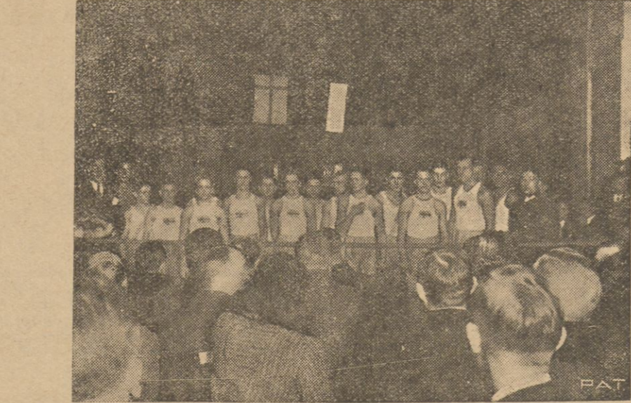
Zdjęcie nasze przedstawia drużynę pięściarską szwedzkiej reprezentacji Sztokholmu...