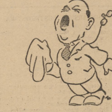
Ale teraz już najwyższy czas, aby zacząć tabletkę oryginalnej Aspiriny!